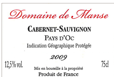
Etiket til det franske marked